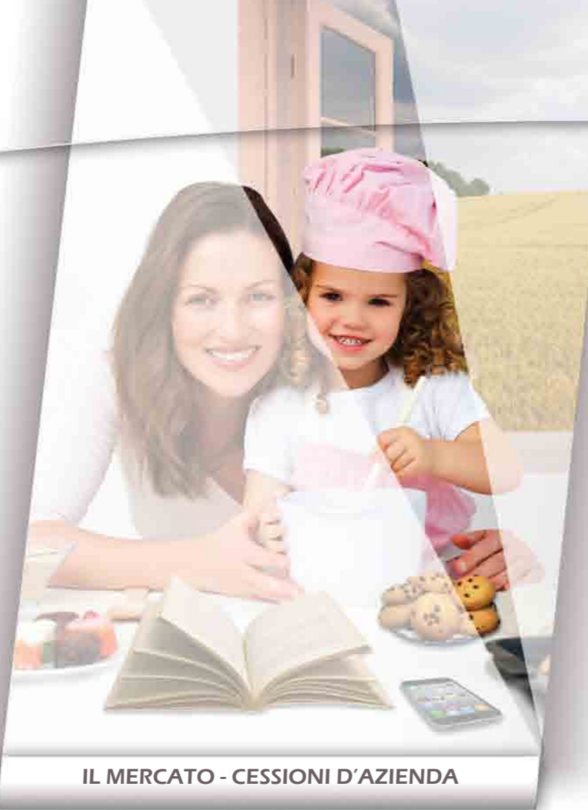
IL MERCATO - CESSIONI D'AZIENDA

La singola operazione ha un inizio e una fine, le relazioni possono vivere per sempre. Coinvolgiamo il mercato come facciamo con i nostri figli!