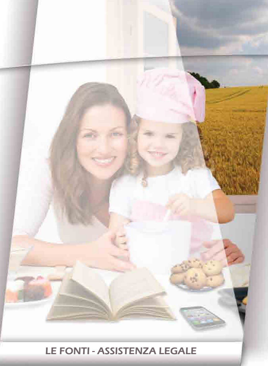
LE FONTI - ASSISTENZA LEGALE

Impiegando il proprio Servizio Legale interno, Sipef è in grado di verificare – costantemente - che l'operato proprio e quello svolto in favore dei clienti sia sempre pienamente conforme alle nuove normative, offrendo in tal modo un grado di sicurezza e di qualità senza confronti.