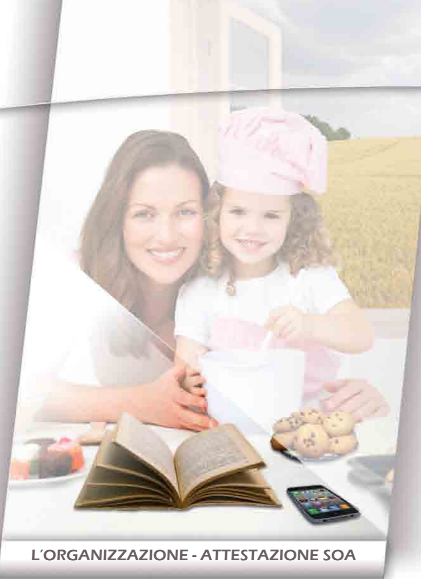
L'ORGANIZZAZIONE - ATTESTAZIONE SOA

La nostra esperienza è il libro dei nostri successi. Rendiamolo grande insieme al nostro futuro!